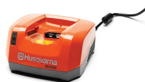
ЗАРЯДНОЕ УСТРОЙСТВО HUSQVARNA 967 09 14-01