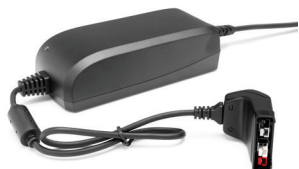
HUSQVARNA CHARGER QC500 967 09 15-01