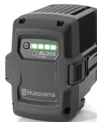
HUSQVARNA АККУМУЛЯТОР BLI300 967 07 19-01