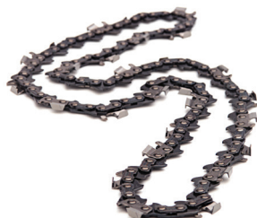
ПИЛЬНАЯ ЦЕПЬ 10"/25CM, H00, 1/4", 1.3MM, 58 ХВОСТОВИКОВ 501 84 40-64