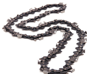
ПИЛЬНАЯ ЦЕПЬ 12"/30CM, H37, 3/8" MINI, 1.3MM, 45 ХВОСТОВИКОВ 576 93 65-40