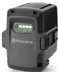
HUSQVARNA BATTERY BLI100 967 09 18-01