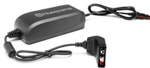
HUSQVARNA CHARGER QC80 967 33 56-31