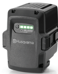
HUSQVARNA BATTERY BLI200 967 09 19-01